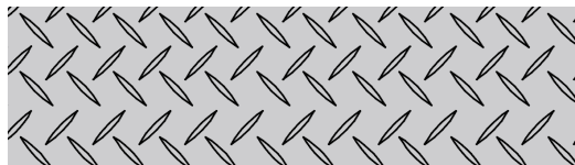
TABLA DE PESOS Y ESPESORES